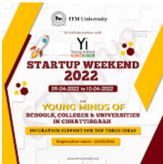
Startup weekend 2022 1-1.jpg 1339K