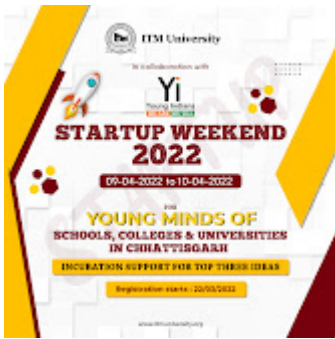
Startup weekend 2022 1-2.jpg 1094K