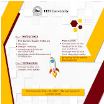
Startup weekend 2022 1-2.jpg 1094K