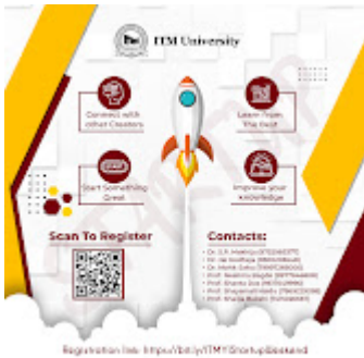
Startup weekend 2022 1-3.jpg