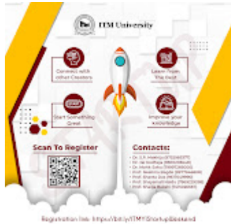
Startup weekend 2022 1-3.jpg 1308K