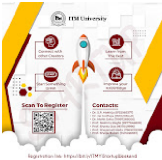
Startup weekend 2022 1-3.jpg 1308K