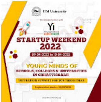
Startup weekend 2022 1-1.jpg 1339K