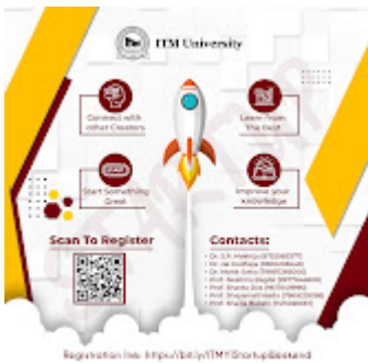
Startup weekend 2022 1-3.jpg 1308K