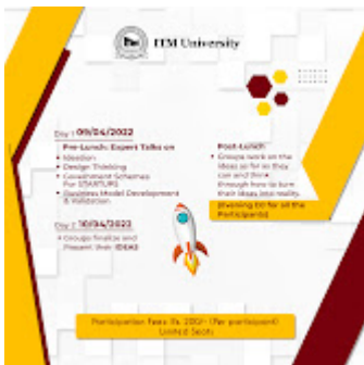
Startup weekend 2022 1-2.jpg 1094K