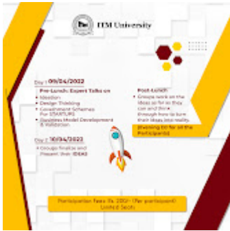
Startup weekend 2022 1-1.jpg 1339K